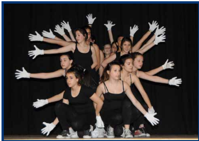
Una coreografia delle alunne