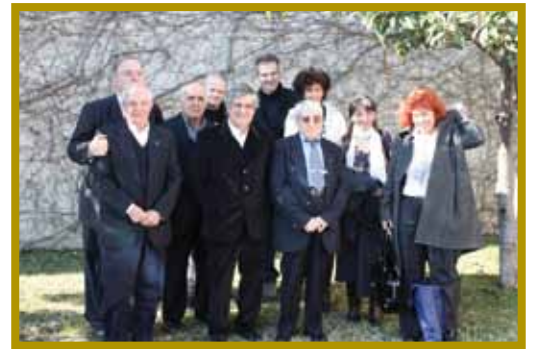
Con i confratelli ed amici presenti