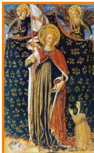
B. Gozzoli - Sant'Orsola

Vista l'impossibilità di presentare foto particolarmente significative, vi suggeriamo di collegarvi al sito "S. Maurizio al Monastero maggiore - navata centrale" e di scoprire in modo interattivo questa meraviglia d'arte ancora poco conosciuta dagli stessi milanesi.