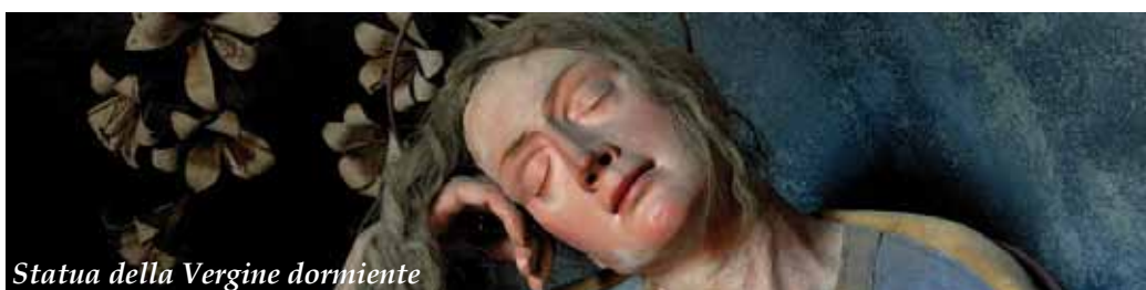
Statua della Vergine dormiente