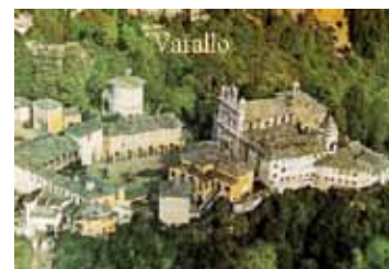
Il nucleo centrale de Santuario

NB: Il bollettino di conto corrente postale allegato potrà essere utile al versamento della quota annuale Associazione Ex Collegio S. Antonio.