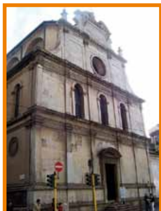
Facciata di S. Maurizio