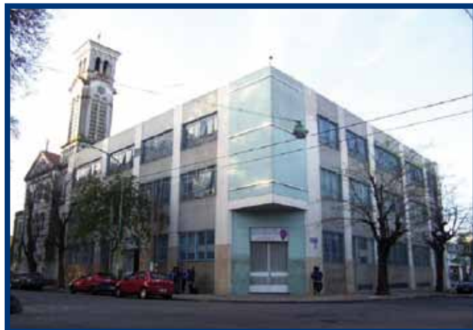
Il nucleo storico del Collegio "N.S. de Lujan"

Per realizzarla si sono immaginate le più moderne concezioni in materia di infrastruttura scolastica: spazi funzionali, aule ampie e luminose, tecnologia d'ultima generazione, il tutto con l'unico intento d'offrire agli alunni ed agli operatori della scuola l'ambiente ideale per istruire ed educare.