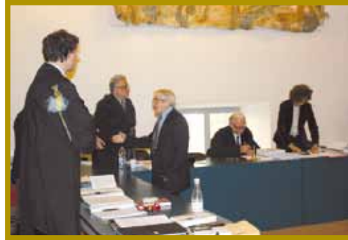
La stretta di mano al neo dottore