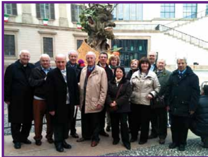
Il gruppo davanti al Palazzo Reale

rie naturalistiche sia poi arrivato alle teste attingendo dalle grottesche di Leonardo da Vinci e dal laborioso clima della città milanese. Diventato un grande pittore fu chiamato alla corte di Praga a lavorare per gli imperatori Ferdinando I, Massimiliano II, e Rodolfo II dove ebbe incarichi anche di scenografie teatrali e costumi di maschere. Le teste arrivano solo alla fine del percorso museale: le quattro stagioni, i quattro elementi (aria, acqua, luce, terra), le buffe e le reversibili.