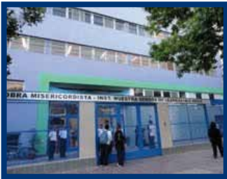
Ingresso della nuova ala

stici e da altre autorità civili e religiose, cui ha fatto corona una folta rappresentanza della Famiglia Misericordista: Confratelli di altre opere, insegnanti d'un tempo ed attuali, alunni, ex alunni, genitori, di cui molti padri di attuali alunni, personale amministrativo, ausiliario e di maestranza, amici.