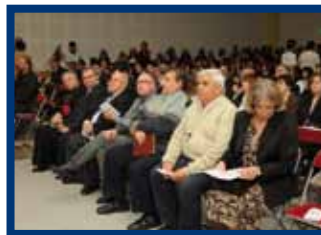
La fila delle autorità

Invitati previamente con le loro famiglie, sono stati oggetto di un pubblico ringraziamento e di un attestato di gratitudine. La mag-