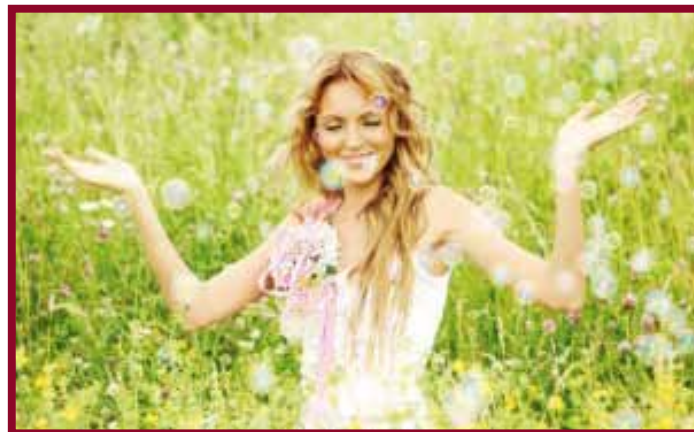
Copertina di "Il primo giorno"