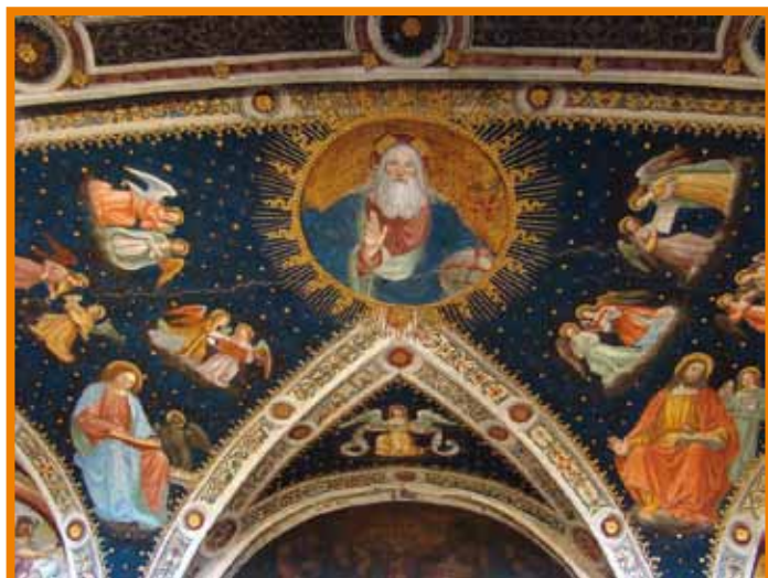
Affreschi della volta