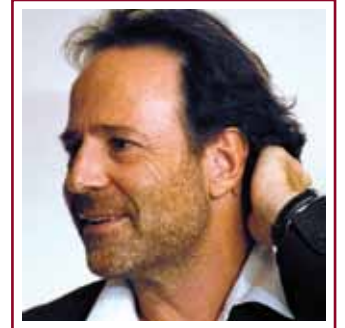
Il romanziere Marc Levy

I miei genitori sono sposati da cinquant'anni e sono ancora innamorati e appassionati. Dieci anni fa mio padre è stato operato agli occhi e ha rischiato di perdere la vista. Un giorno sono andato a trovarlo e l'ho trovato con i mocassini lucidi, i pantaloni di flanella e la cravatta verde. Gli ho chiesto che ci faceva vestito così e mi ha risposto: Amo tua madre da quarant'anni e non voglio rischiare di perderla ora che divento cieco.