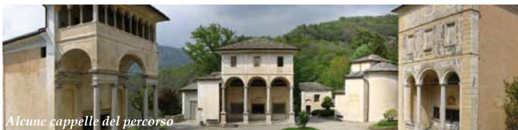
Alcune cappelle del percorso

Il Sacro Monte fu molto amato dal Santo arcivescovo Carlo Borromeo che vi soggiornò almeno quattro volte nel corso della sua vita e vi lasciò testimonianze di una grande devozione per i luoghi della Passione di Gesù. La nostra scelta vuol essere un omaggio al S. Arcivescovo nel quarto centenario della sua canonizzazione.