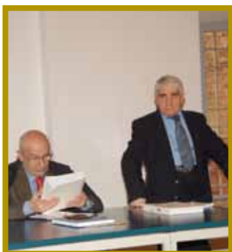
L'attesa della sentenza