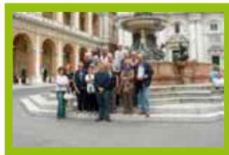
Loreto - piazza della basilica