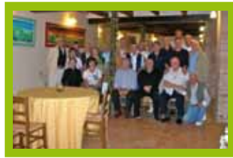
Il gruppo con gli ex di Jesi

E' quasi mezzogiorno e puntiamo su Ostra Vetere, uno dei tanti civilissimi paesi, che emergono dall'ondeggiante mare delle collinette marchigiane, coltivate in modo splendido ed in questo momento coperte, per lo più, da gialle e verdi distese di ancor giovani girasoli. Una delizia per gli occhi! A questo punto si scatena uno dei tanti scroscioni