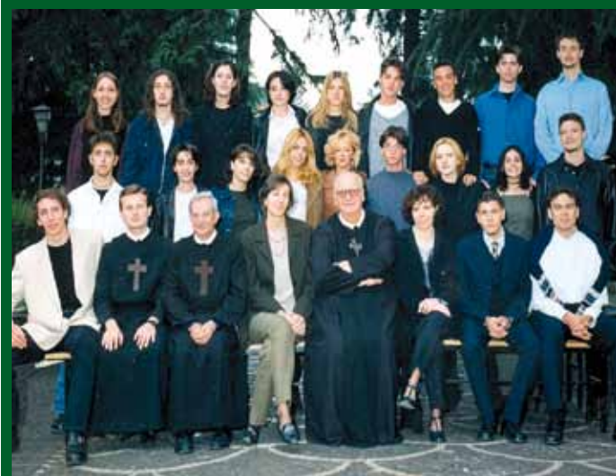
ANNO SCOL. 1998/99 - QUINTO LICEO B