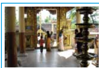
Un templo indù

gnora della Misericordia sta tentando di creare una Comunità di Fratelli indiani.