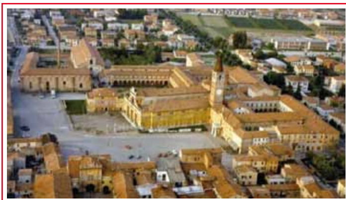
Complesso dell'abbazia di S. Benedetto Po (MV)

ritrovati in cinquantaquattro a riempire il bel pullman gran turismo. Il clima esterno non è dei più incoraggianti visto che il cielo è carico di nuvoloni, ma quello interno è decisamente attestato al bello, per lo scopo che ci anima (la celebrazione della Comunione pasquale), per il programma della giornata e per la carica di simpatia umana