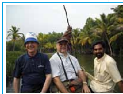
Viaggio sul fiume

stanno aiutando, i quattro Fratelli che si sono resi disponibili a seguire questa piccola missione. La Congregazione ha contribuito a costruire un nuovo seminario, che è stato inaugurato il primo maggio di quest'anno, ed ha già acquistato il terreno dove sorgerà la casa di formazione nella Diocesi di Neyyattinkara. Alcune persone (Cooperatrici, amici dei Fratelli) hanno "adottato a distanza" questi seminaristi per i loro studi. Se il Signore lo vorrà, l'esito sarà sicuramente positivo, nonostante i nostri poveri mezzi. L'esito che ci attendiamo, secondo il progetto del Superiore Generale, è quello di iniziare un'opera della Congregazione in India con Fratelli Indiani. Per ora le vocazioni non mancano. Per ora c'è anche la buona volontà della Congregazione.