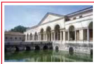
Sopra: Palazzo tè; A destra: L'incontro di Canossa: Matilde, Gregorio VII e Enrico IV (miniatura); Sotto: Mantova - panorama