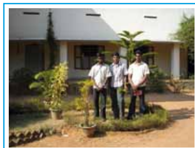
I primi tre nostri seminaristi