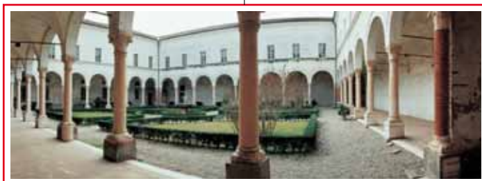
Abbazia - Un chiostro

L'interno si articola in numerose sale, mirabilmente affrescate dallo stesso Romano ed allievi. Le più famose sono la sala dei giganti, quella dei cavalli con i ritratti di sei destrieri preferiti