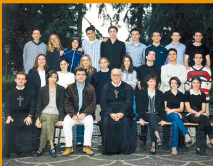
ANNO SCOL. 1998/99 - QUINTO LICEO A

Ore 19:00 Chiusura del raduno e arrivederci al prossimo anno!