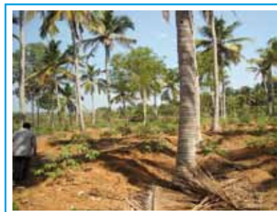
Il terreno della nostra futura opera