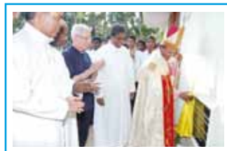
Prima pietra seminario

Qui nel Kerala, e più precisamente nella giovane (ha solo tredici anni di vita) diocesi di Neyyattinkara, la nostra Congregazione dei Fratelli di Nostra Si-